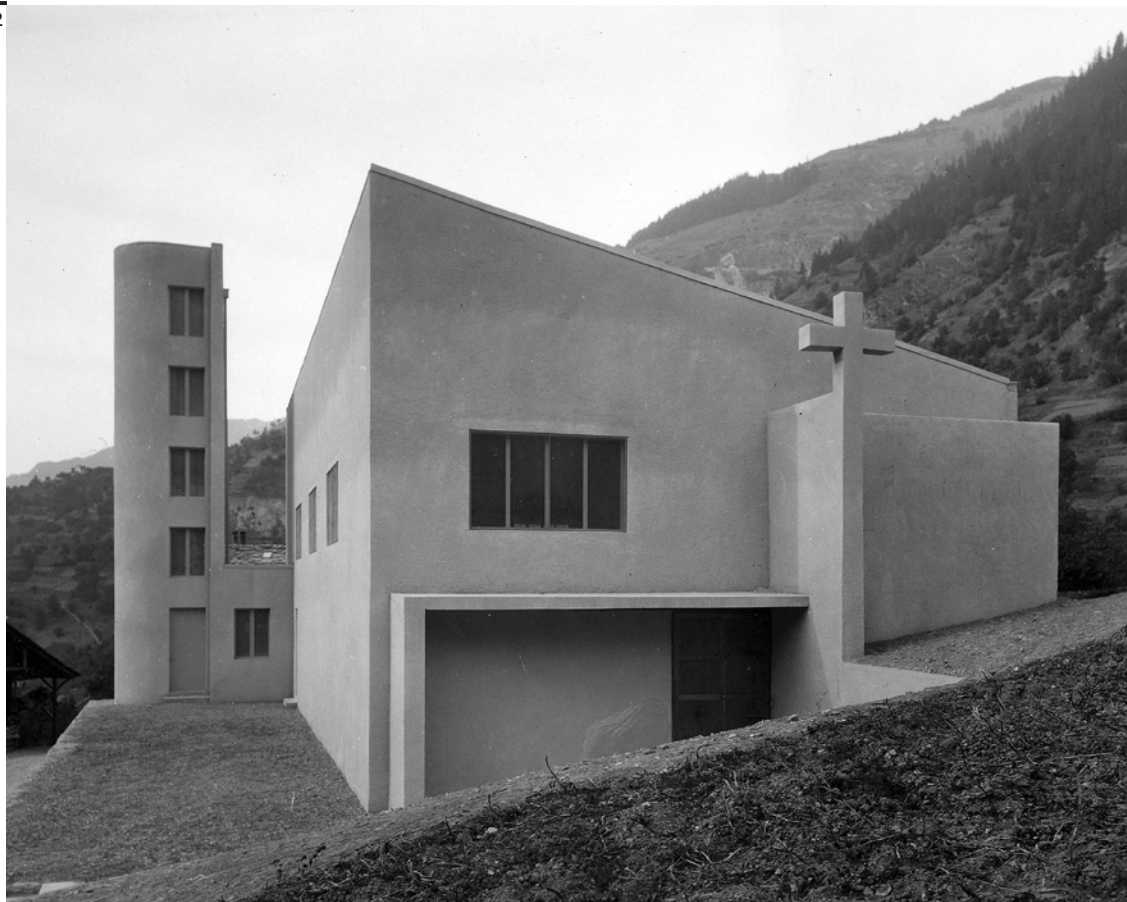
Fig. 2 Église Notre-Dame- du-Bon-Conseil, Lourtier, Alberto Sartoris, 1932.